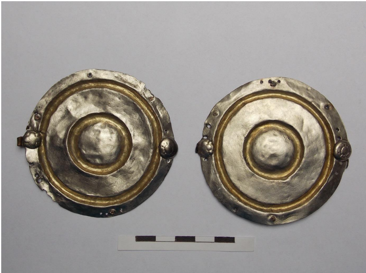
9. ábra Hajfonatkorong-pár (17. sír, felülnézet)