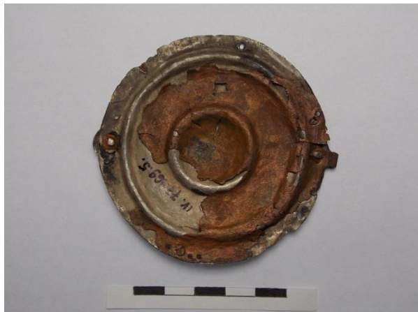
5–6. ábra Hajfonatkorong-pár (17. sír) egyik tagja (előlnézet–hátnézet)