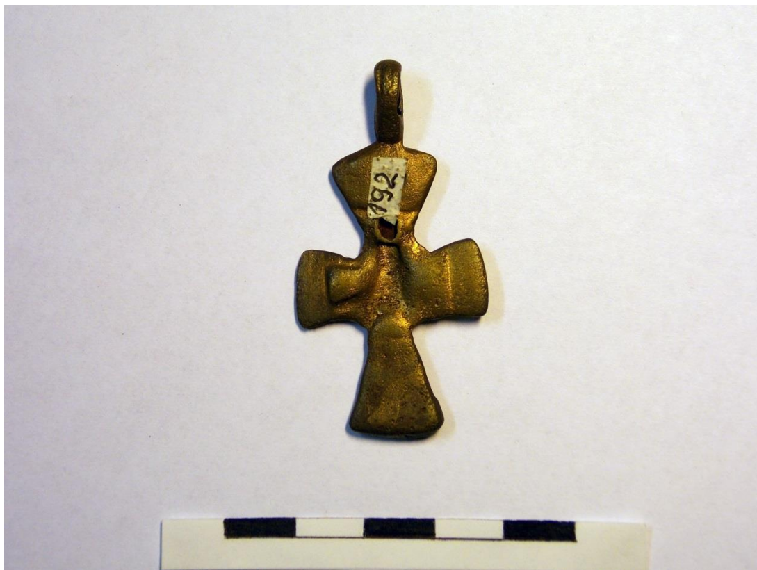
12. ábra Egyszerű bronz mellkereszt (107. sír, alulnézet)