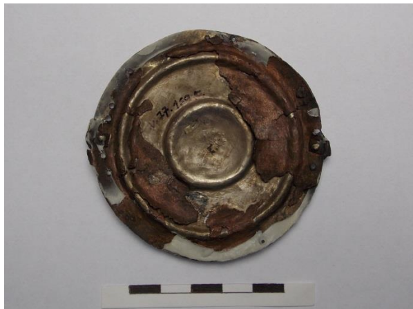
7–8. ábra Hajfonatkorong-pár (17. sír) másik tagja (előlnézet–hátnézet)