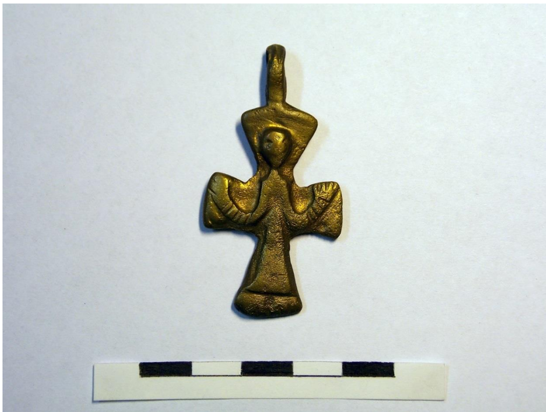
11. ábra Egyszerű bronz mellkereszt (107. sír, felülnézet)