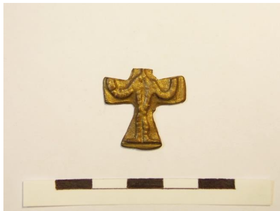
10. ábra Egyszerű bronz mellkereszt (95. sír, felülnézet)

A két, egyoldalas mellkereszt a 95. és a 107. sírban egyaránt az eltemetett kisgyermek nyakába lehetett felfűzve, és típus szerint az öntött, „antropomorf” ábrázolásúak közé tartozik. A 95. sír példánya kisebb, felső része letört, így a gyöngyözéssel ábrázolt körvonalú corpus feje hiányzik. A másik keresztnek széles, bordázott függesztőfület alakítottak ki. A corpus felfelé hajló karjait díszítik még bordák, az alak maga leplet visel.